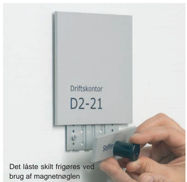
Det låste skilt frigøres ved brug af magnetnøglen